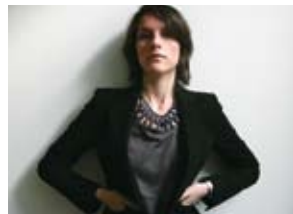
主编 Selva Barni 本身是资深摄影师，居于米兰。